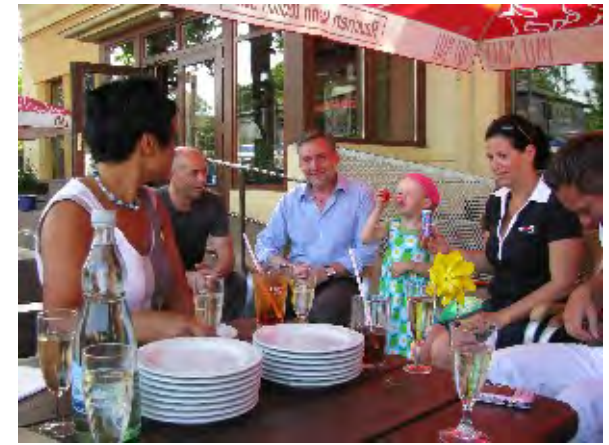
Draußen ging es weiter!