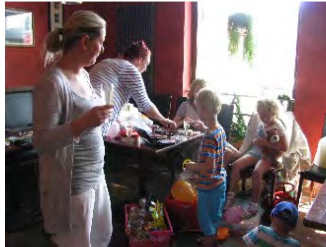
Auch für die Jüngeren war gut gesorgt!